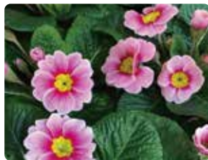
プリムラ・ジュリアン