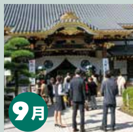
杉並中野支店 新築工事地鎮祭