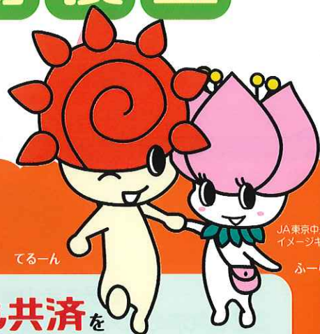
JA東京中央のイメージキャラクター てるーん ふーら